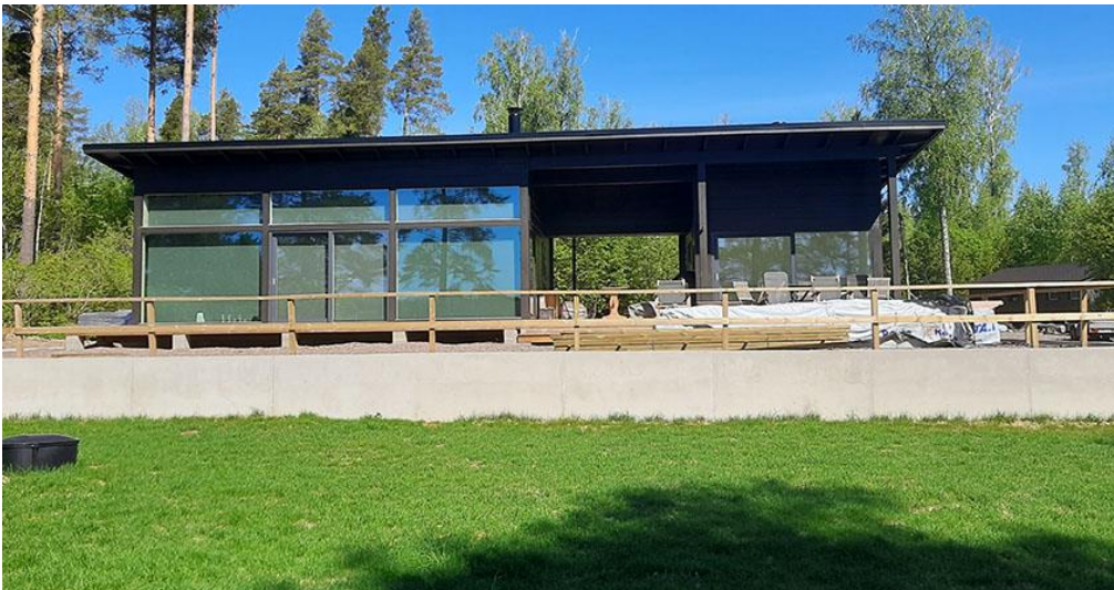
Kuva 6. Uusi loma-asunto rannan suunnasta.