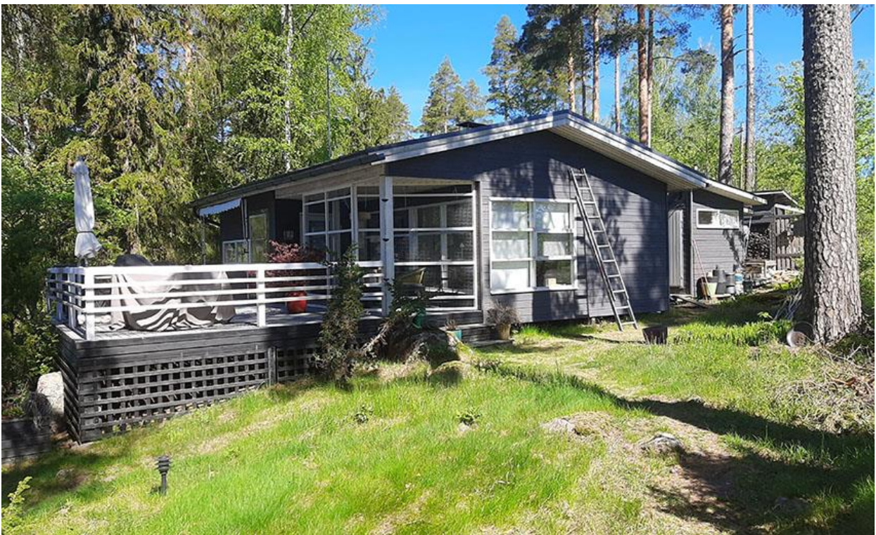
Kuva 4. Loma-asunto kuvattuna lounaan suunnasta.