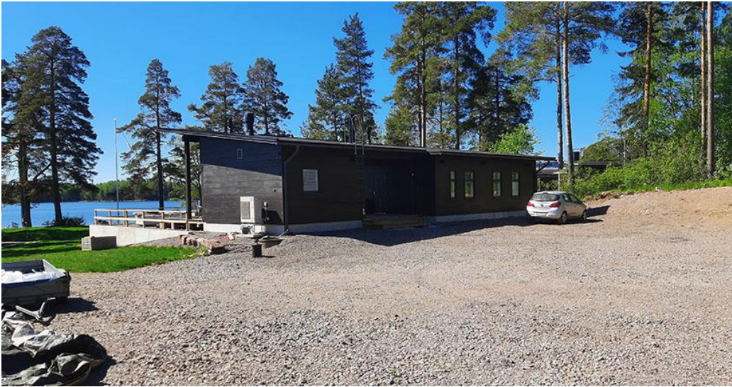
Kuva 5. Juuri valmistunut loma-asunto.