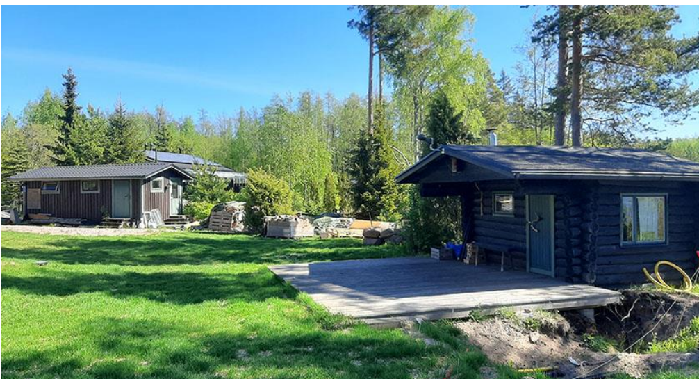
Kuva 7. Sauna oikealla, ja liiteri.