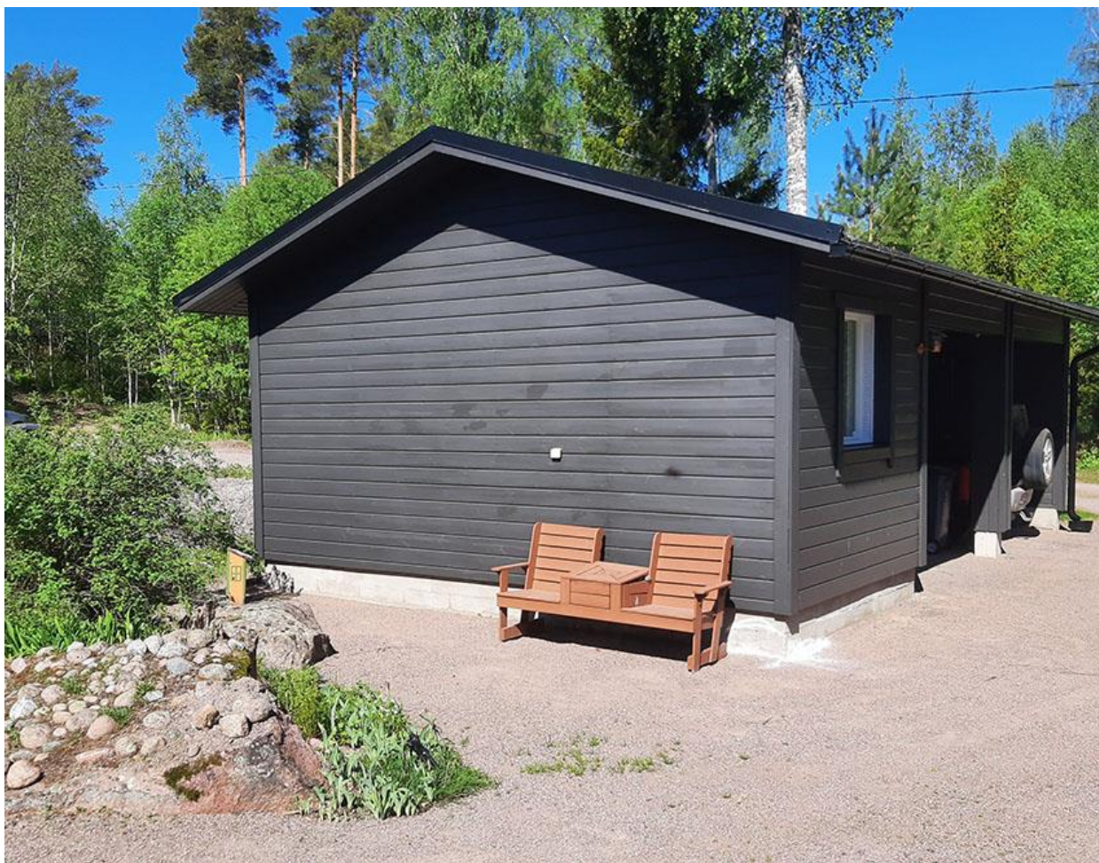
Kuva 14. Liiteri-autokatos.