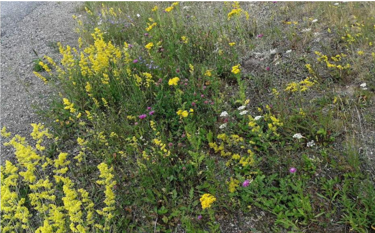
Kuva 4. Keltamataraa osa-alueella 1.