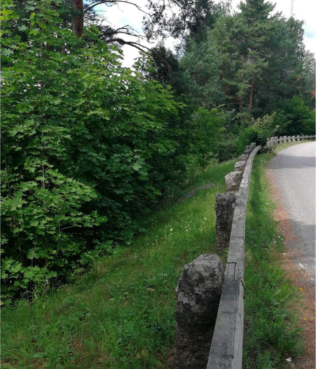
Kuva 7. Varjoisaa piennarta osa-alueella 7.

on "kaakko-länsi-suuntainen harju- tai reunamuodostuman rinnealue, jonka kaltevuus on vähintään viisi prosenttia, humuskerros ohut, pohjakerros aukkoinen ja puuston latvuspeittävyys enintään 60 prosenttia, ja jolla kasvaa häränsilmää, kalliokieloa, kangasajuruohoa, ahokissankäpälää tai vastaavia harjuille tyypillisiä lajeja". Kohde ei vastaa luontotyypin määritelmää ainakaan lajiston osalta, ehkä ei myöskään latvuspeittävyden osalta. Näin ollen kyseessä ei ole luonnonsuojelulain 64 §:n nojalla suojeltu luontotyyppi.