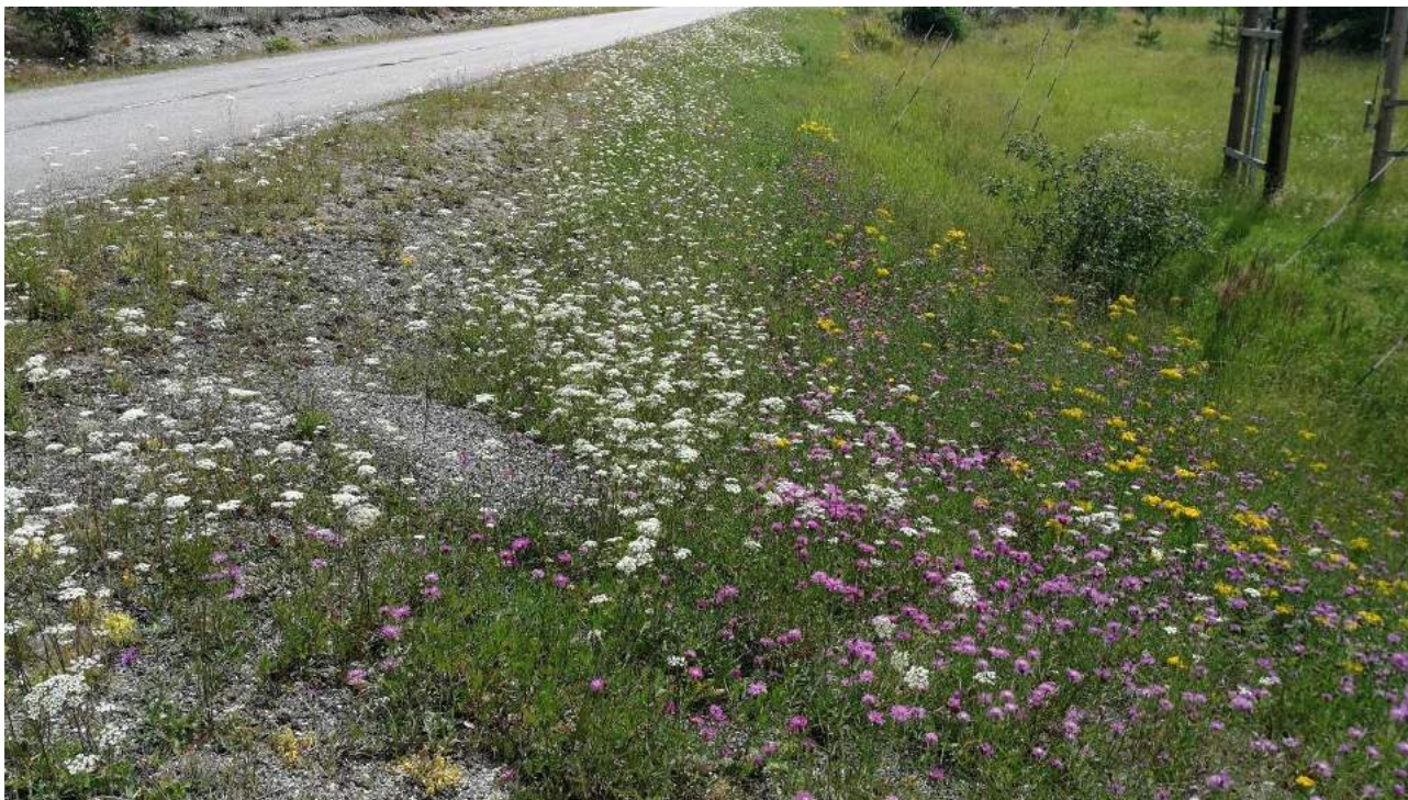
Kuva 6. Osa-alue 5 pohjoispäästä etelään päin kuvattuna.