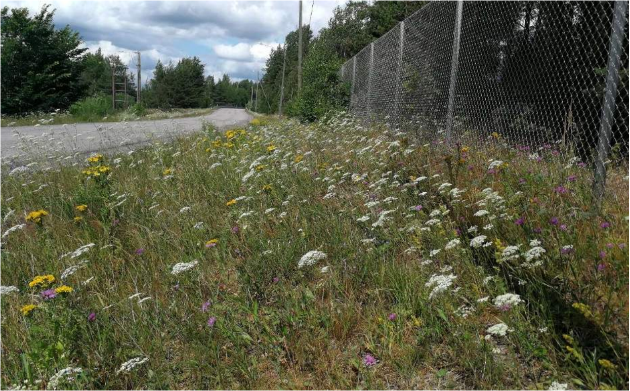
Kuva 3. Osa-alueen 1 eteläosan monilajista ketoa.