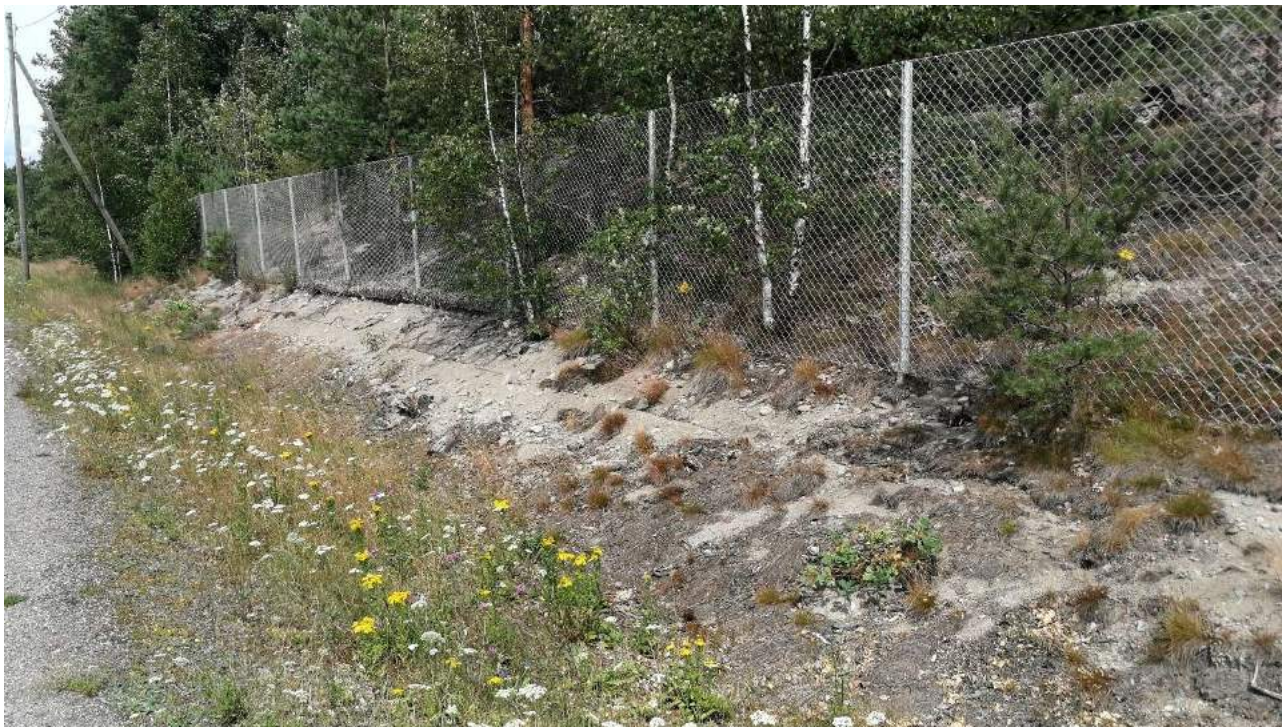
Kuva 5. Kasvillisuutta on poistettu luiskalta osa-alueella 2.