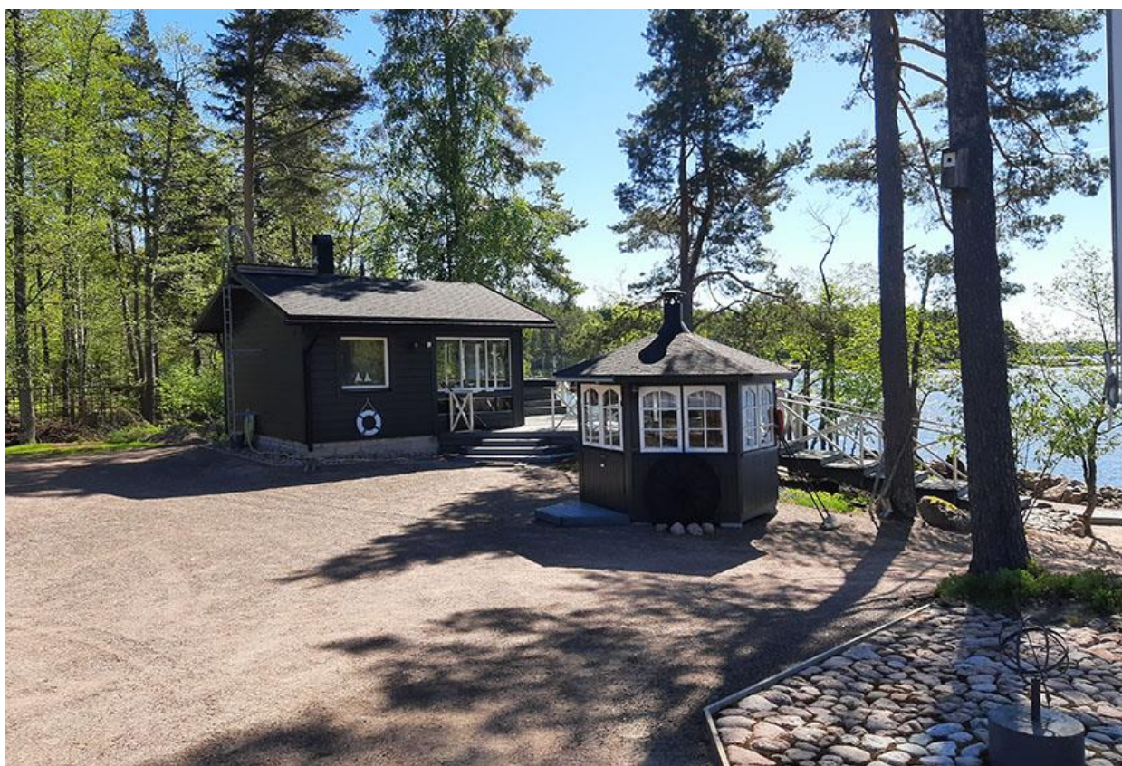
Bild 9. Strandbastun och minipaviljongen.