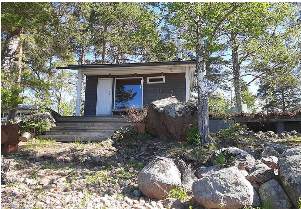
Bild 2. Bastun forograferad från strandhället.