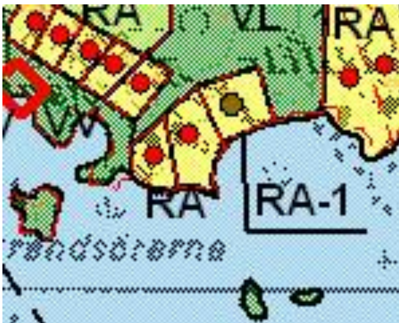
Utdrag ur den gällande stranddelgeneralplanen för Kulla-Lappom.

För området gäller stranddelgeneralplanen för Kulla-Lappom, som godkänts 24.2.2003. I planen är stranddetaljplaneområdet som ska ändras anvisats för fritidsbebyggelse med 3 fritidstomter. Byggrätten är anvisad med effektivitetstalet e=0,05 , dock högst med 250 m 2 våningsyta. Byggrätten för fastighetstomten 7-7 är anvisad i enlighet med den gällande stranddetaljplanen.