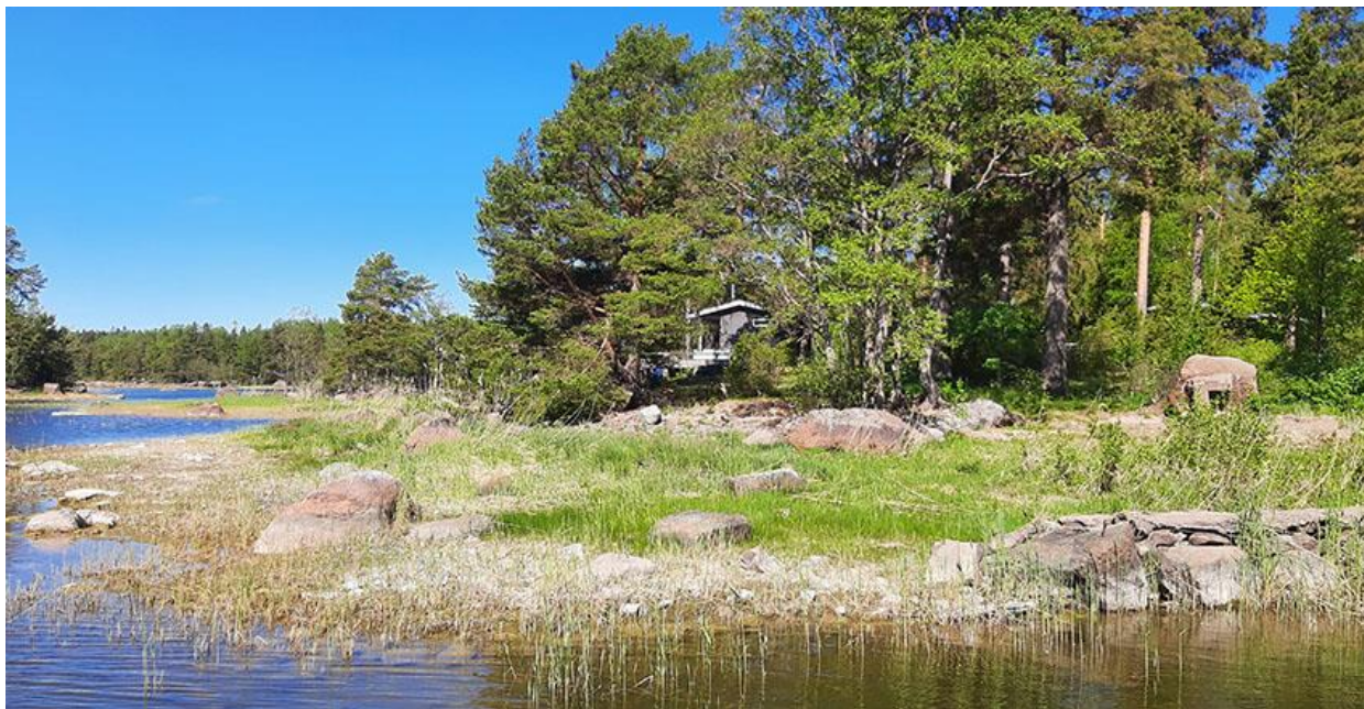
Bild 1. Byggplatsens strandlandskap.