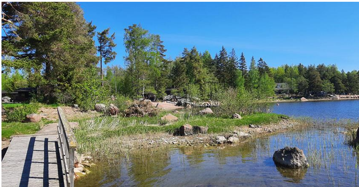
Bild 15. Strandlandskapet vid byggplats 3 fotograferat från bryggan på byggplats. Bastun syns i mitten på bilden, grannens fritidsbostad på den högra sidan.