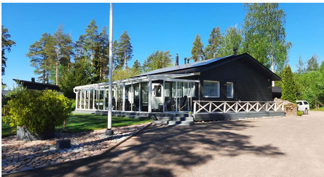
Bild 12. Fritidsbostaden fotograferad från bastuhållet.