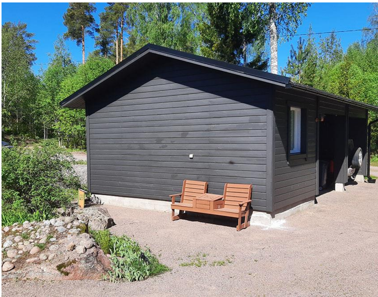
Bild 14. Lider-biltak.