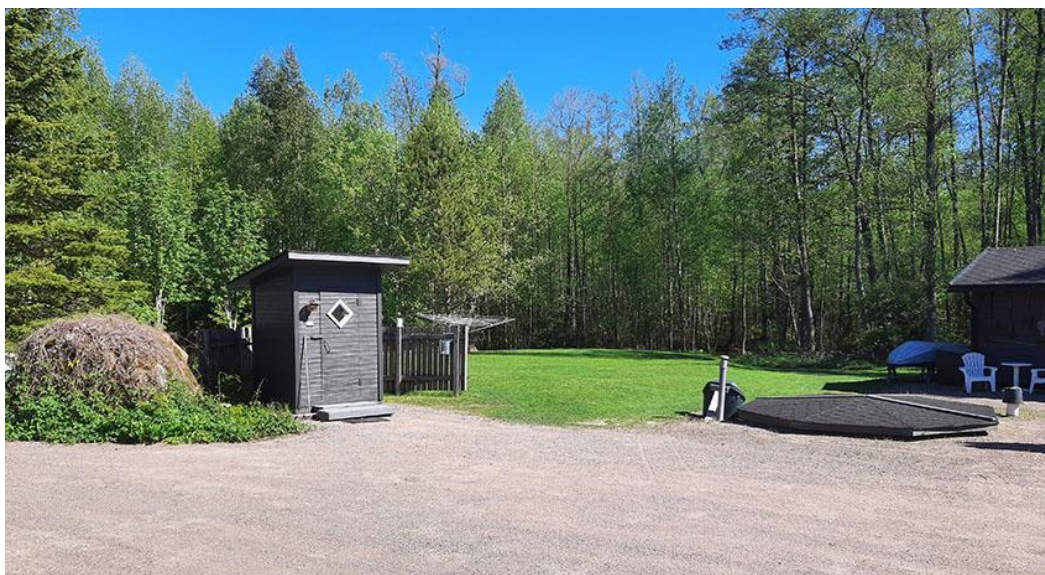
Bild 11. Lidret på den förra bilden i den högra kanten, dasset i mitten på bilden.